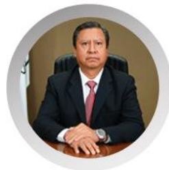
Mtro. Francisco Bello Corona CONSEJERO ELECTORAL